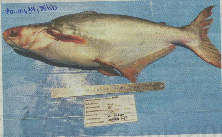
IKAN patin hitam antara tiga jenis ikan asing yang ditemukan di Sungai Linggi menerusi Inventori Perikanan Darat yang dilaksanakan pihak Jabatan Perikanan Negeri Sembilan di Pengkalan Kempas, Port Dickson.

Jelas Kasim lagi, ikan-ikan asli yang ditemukan di Sungai Linggi antaranya ikan duri, ikan sumpit, ikan selat, udang galah, ikan haruan pasir, ikan