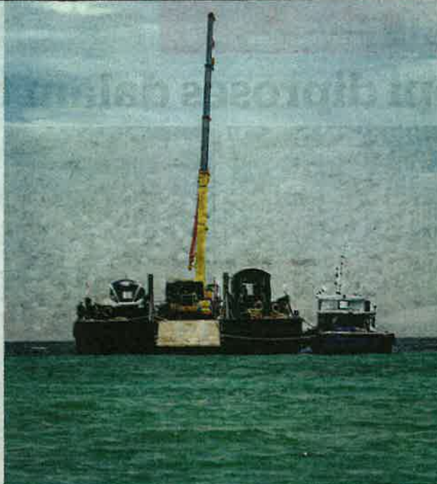
DUA gerabak LRT dan kren dibawa ke Pulau Tioman menaiki tongkang.

"Kami akan mulakan dengan spesies terumbu acropora yang akan tumbuh secara semula jadi sepanjang dua hingga tiga inci setahun", jelasnya.