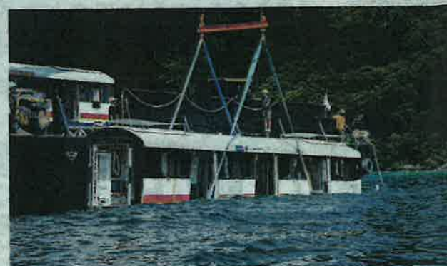
SEBANYAK dua gerabak LRT dilabuhkan di dasar laut sebagai tukun tiruan.

melakukan kerja-kerja melabuhkan LRT. "Tukung Meng terdiri daripada penyelam pelbagai kepakaran termasuk pengajar skuba, jurutera struktur, ahli biologi marin dan pakar perubatan hiperbark," katanya.