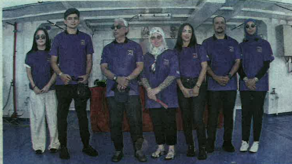
AL-SULTAN ABDULLAH (tiga dari kiri), Tunku Azizah (tengah) dan Tengku Hassanah (dua dari kiri) bergambar kenangan sewaktu majlis pelancaran MBOR: The First LRT Coach Reef in Malaysia di Pulau Tioman, Pahang baru-baru ini.

"Setelah lebih kurang dua bulan melakukan perbincangan dengan pihak YASA dan Jabatan Perikanan Malaysia (DOF), kami (Tukung Meng) mula