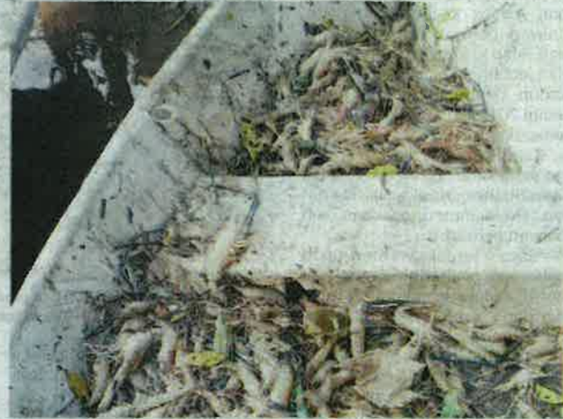
SEBAHAGIAN udang galah yang mati disebabkan berlakunya pencemaran di Sungai Tanjung Air Hitam.