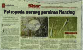
Laporan Sinar Harian 5 Julai lalu.

Jabatan Perikanan Negeri Johor (JPNJ) mengesahkan tiada lagi rebakan organisma berbahaya petropoda atau nama saintifiknya, Creseus Acicula , dikesan di kepulauan sekitar daerah ini terutama Pulau Mertang, Pulau