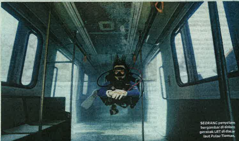
SEORANG penyelam bergambar di dalam gerabak LRT di dasar laut Pulau Tioman.

Mengulas lanjut, Al-Sultan Abdullah berharap, penduduk di Pulau Tioman dapat menjaga kebersihan sungai, selain memastikan kawasan di sekeliling rumah terjaga.