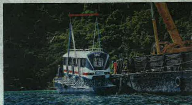
PROSES melabuhkan gerabak LRT dilakukan dengan berhati-hati menggunakan kren.