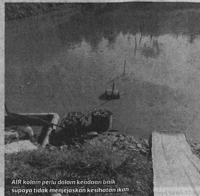
AIR kolam perlu dalam keadaan baik supaya tidak menjejaskan kesihatan ikan.