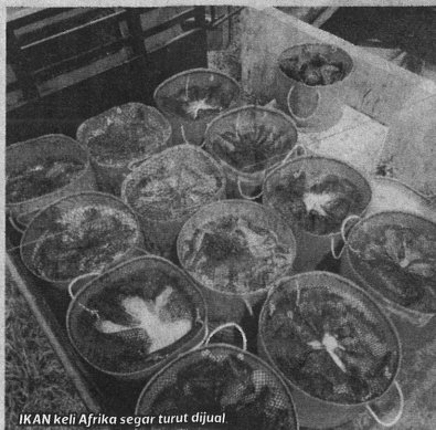
IKAN keli Afrika segar, turut dijual.