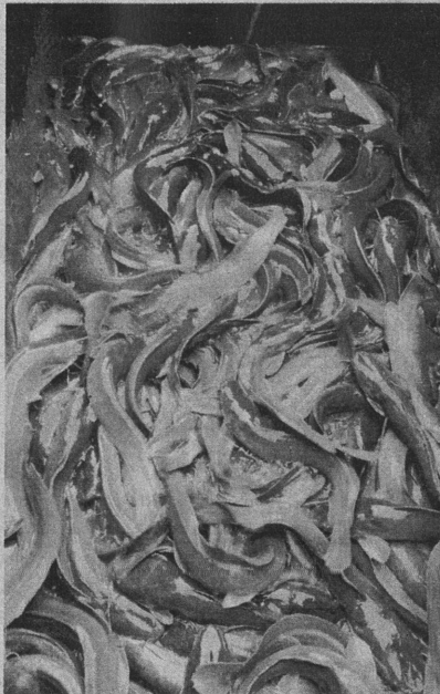
IKAN keli Afrika mengambil masa tiga bulan untuk matang.

"Saya boleh katakan jumlah ternakan ikan keli Afrika milik saya kira-kira