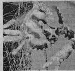
SEEKOR ketam yang 'hancur' akibat dilanggar bot pukak tunda.