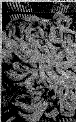
Hasil tangkapan udang meningkat dalam tempoh musim tengkujuh.