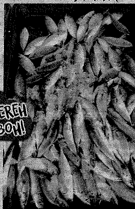
Sebahagian tangkapan ikan selayang hasil nelayan turun ke laut selepas tiga bulan tidak dapat turun ke laut.

"Apabila cuaca baik, kami kembali ke laut mencari rezeki selepas tidak mempunyai punca pendapatan langsung selama tiga bulan ini," katanya ketika ditemui pada Program Community Policing Ketua Polis Bachok bersama badan bukan kerajaan (NGO) Rakyat Dekat di Hati