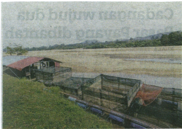
BEGINILAH keadaan Sungai Pahang yang kering hingga menjejaskan penternakan ikan sangkar di beberapa kampung berdekatan.