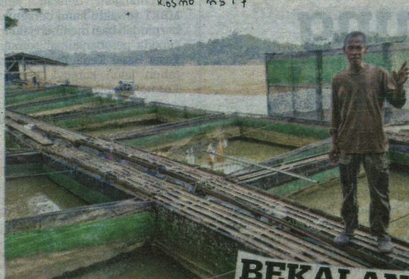
JAMIL kerugian RM60,000 ekoran benih ikan mati di Sungai Pahang.

"Saya ternak ikan sejak 2020 tetapi kali ini benar-benar terasa 'sakit' kerana terpaksa jual ikan yang belum matang sebelum ia mati. Sepatutnya dijual pada harga RM22 sekilogram tetapi sebab tak mahu rugi, kena lelong RM16,"