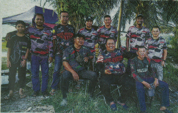
SEBAHAGIAN ahli RMH yang aktif memburu BEM terutamanya di Sungai Selangor.

Pastikan anda bersedia dari segi mental dan fizikal jika berhasrat memburu BEM bertamie mega.