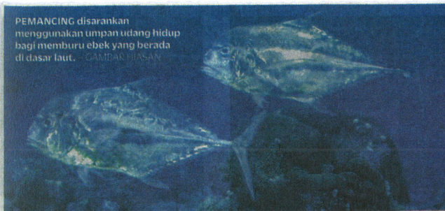
PEMANCING disarankan menggunakan umpan udang hidup bagi memburu ebek yang berada di dasar laut. — GAMBAR ILMU