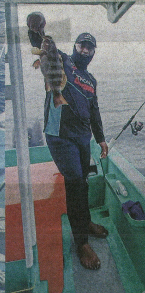
KERAPU merupakan spesies ikan yang jarang ditemui di Lubuk Ebek.

yang diperlukan adalah umpan hidup, biasanya saya menggunakan udang. "Kelengkapan memancing juga perlu bersesuaian kerana untuk memburu ebek, kita akan menggunakan teknik bottom (memancing dasar)," ujarnya.