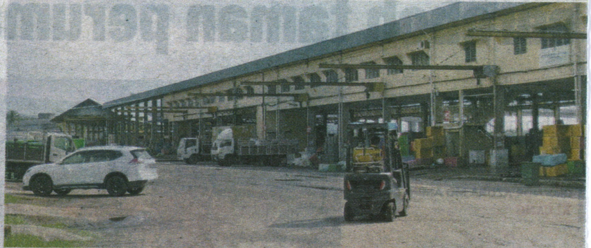
Aktiviti pendaratan ikan di Jeti Lembaga Kemajuan Ikan Malaysia di Kemunting, Tanah Putih Baru, Kuantan berjalan seperti biasa walaupun berlaku gangguan bekalan ais.

"Susulan itu, Bahagian Keselamatan dan Kualiti Makanan, Jabatan Kesihatan Negeri Pahang (JKNP) telah menjalankan aktiviti merampas peralatan di bawah Seksyen 4(1) (g), Akta Makanan 1983 di pre-