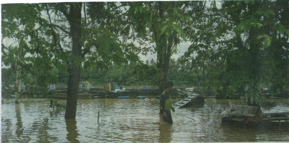
NAIM Man meninjau ikan sangkar di tempat penternakannya di Kampung Pantai Ali.