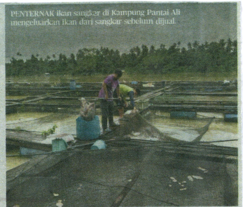
PENTERNAK ikan sangkar di Kampung Pantai Ali mengehadkan ikan dari sangkar sebelum dijual.

Katanya, secara kebiasaan air bercampur lumpur tebal mengakibatkan ikan mudah mati selain arus deras juga