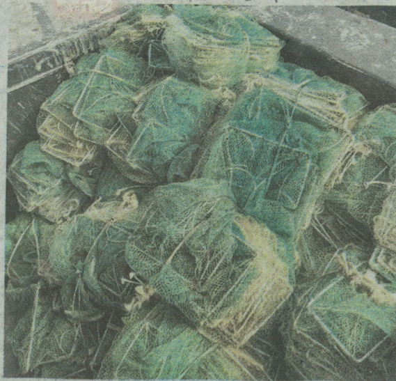
Antara bubu kambang yang dirampas dan dibawa pulang ke Jeti Zon Maritim Kuala Kedah untuk siasatan.

Menurutnya, kesemua bubu naga yang dianggarkan bernilai RM12,840 itu dirampas dan dibawa ke Jeti Zon Maritim Kuala Kedah untuk disiasat mengikut Seksyen 11(3)(c) Akta Perikanan 1985.