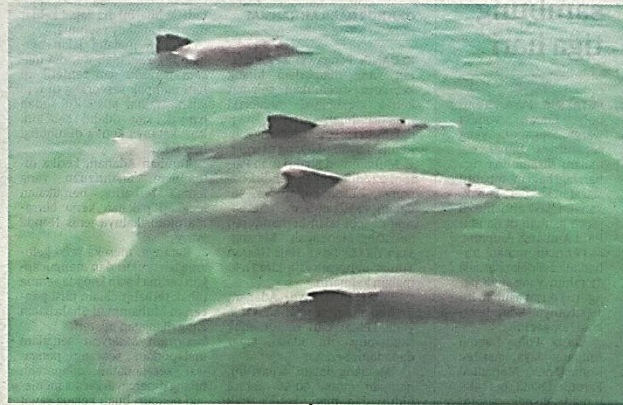
CADANGAN menjadikan Kuala Perlis sebagai lokasi pelancongan ikan lumba-lumba mendapat reaksi positif kerajaan negeri, sekali gus bakal menjadi daya tarikan baharu pelancong ke Perlis.

"Kewujudan lokasi pelancongan ikan lumba-lumba itu bakal memberi impak positif kepada pelancongan negeri ini selain mampu memberi pendapatan sampingan kepada nelayan melalui pakej-pakej membawa pelancong menyaksikan ikan berkenaan.