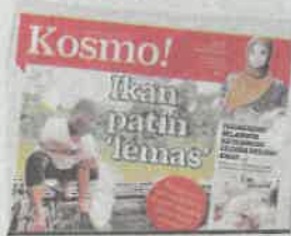
KERATAN Kosmo! semalam.

"Jadi saya mencadangkan agar penternak ikan patin di Sungai Pahang menjadi ahli konsortium ini agar kebajikan mereka lebih terbelas selain tidak menghadapi masalah memasarkan ikan," katanya ketika ditemui selepas Mesyuarat Agong Angkasa Pahang Barat di sini semalam.