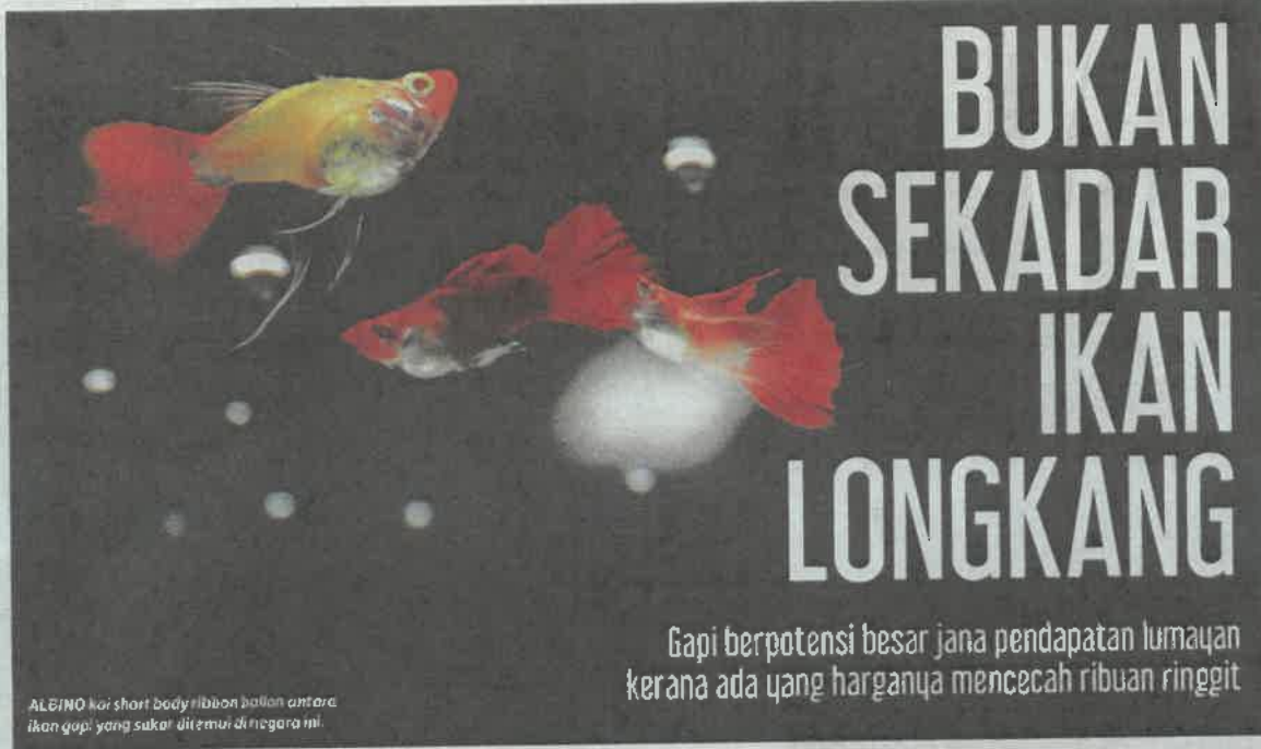
ALBINO koi short body ribbon ballon antara ikan gapi yang sukar ditemui di negara ini.