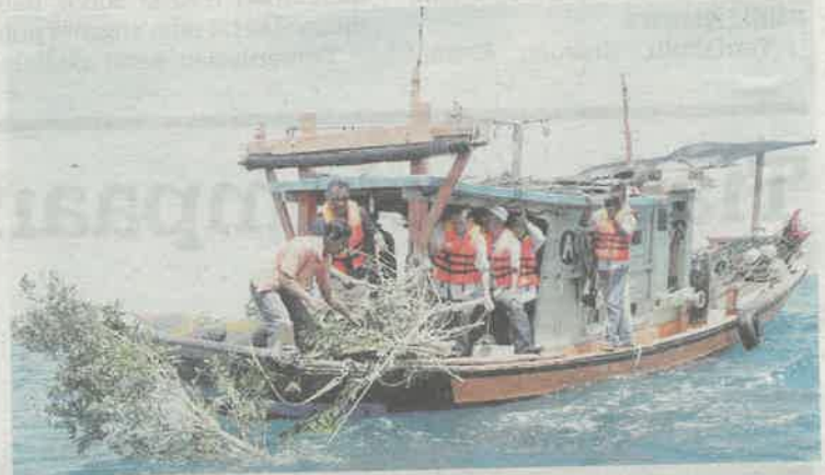
ISU harga kelengkapan menangkap ikan yang tinggi antara bebanan yang ditanggung nelayan sepanjang Covid-19. – GAMBAR HIASAN

Hidup Nelayan (ESHN) harus dikekalkan dan kajian pertambahan jumlahnya perlu dibuat agar sesuai dengan harga barangan selain kos sara hidup yang semakin meningkat.