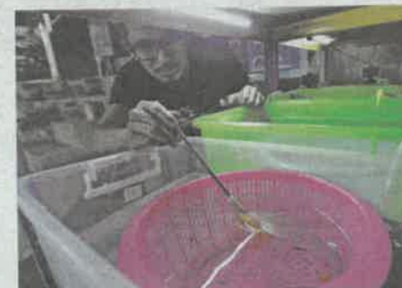
WAD 'berulin' untuk ikan gapi.