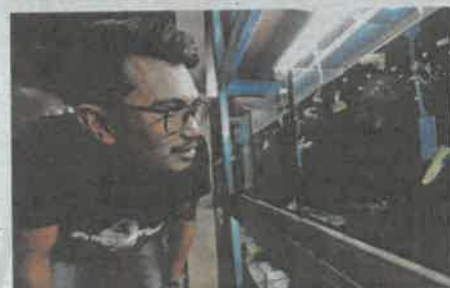
IKAN gapi memiliki potensi besar untuk dikembangkan di negara ini.

"Inilah yang saya cuba buat sekarang untuk buktikan bahawa ikan gapi boleh menjadi sumber pendapatan sekali gus mewujudkan peluang pekerjaan baharu di negara ini," katanya.