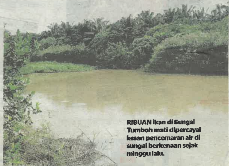
RIBUAN ikan di Sungai Tumbuh mati dipercayai kesan pencemaran air di sungai berkenaan sejak minggu lalu.