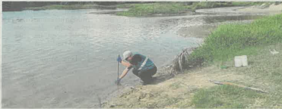
PEGAWAI JAS mengambil sampel air di Sungai Tumboh, Kampung Gajah.