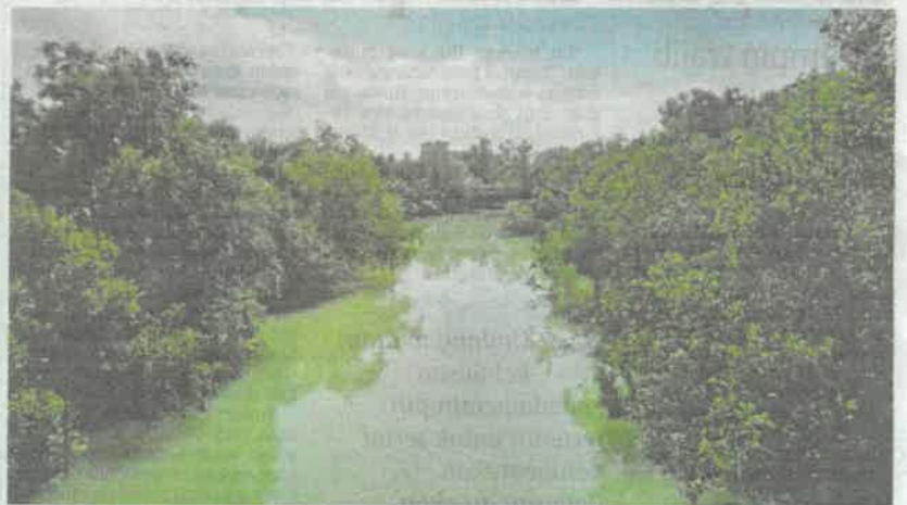
Kondisi Sungai Buloh yang berwarna gelap dipercayai akibat dicemari sisa pencemaran industri.

Menurut dokumen itu, lembangan Sungai Buloh yang menjadi antara lembangan tercemar di Selangor mengalami penurunan kualiti air berikutan pembinaan perindustrian dan komersial yang pesat di kawasan persekitarannya.