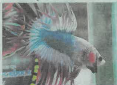
Antara jenis ikan laga yang dibiak Requeal di rumahnya di Tuaran.