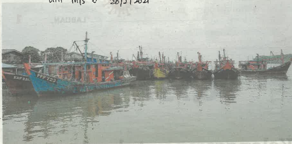
DERETAN bot nelayan yang tersadai berikutan ketiadaan awak-awak warga asing di Jeti Nelayan Kuala Kedah, semalam.