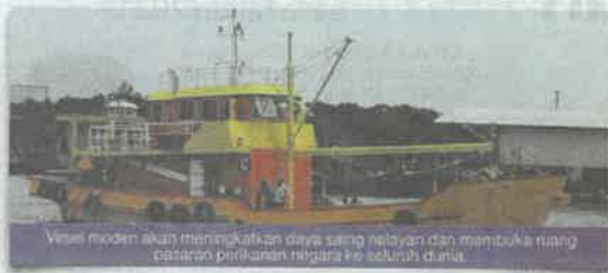
Vesel moden akan meningkatkan daya silih nelayan dan membuka ruang pasaran perikanan negara ke seluruh dunia.

Hala tuju baharu Jabatan Perikanan tingkatkan hasil tangkapan negara