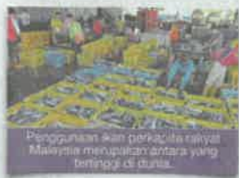
Penggunaan ikan perkapita rakyat Malaysia merupakan antara yang tertinggi di dunia.

Rejimempun katanya, kerjasama dan sokongan daripada pemain-pemain industri sangat diperlukan untuk memahatni dan mematuhi segala dasar serta perancangan kementerian.