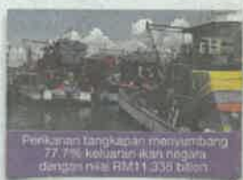
Perikanan tangkapan menyumbang 77.7% keluaran ikan negara dengan nilai RM11.336 bilion.