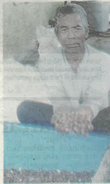
ANTARA kerang yang diperolehi nelayan dari pesisiran laut Tampok, Pontian baru-baru ini.

"Seramai 40 nelayan pula melakukan kerja-kerja menyauk benih kerang dengan kebenaran oleh Jabatan Perikanan selama