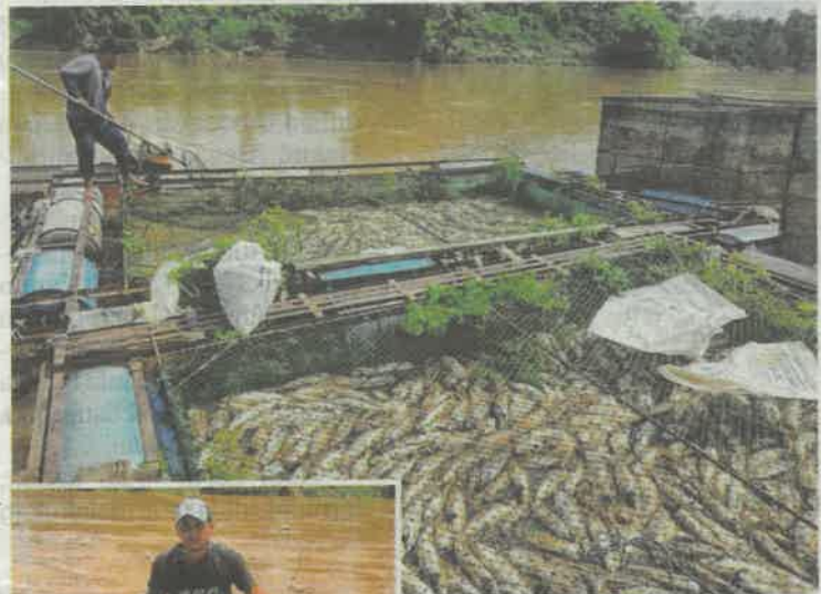
Ribuan ikan patin yang diusahakan beberapa pengusaha di Sungai Pahang dekat Kampung Lada, Jerantut yang mati sejak beberapa hari lalu.