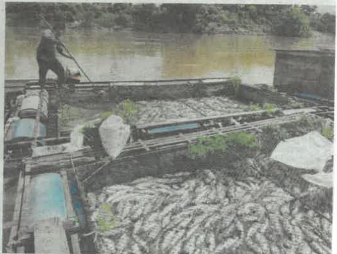
A fish farmer picking up the 'ikan patin' carcasses from their cages along Sungai Pahang near Jerantut yesterday.