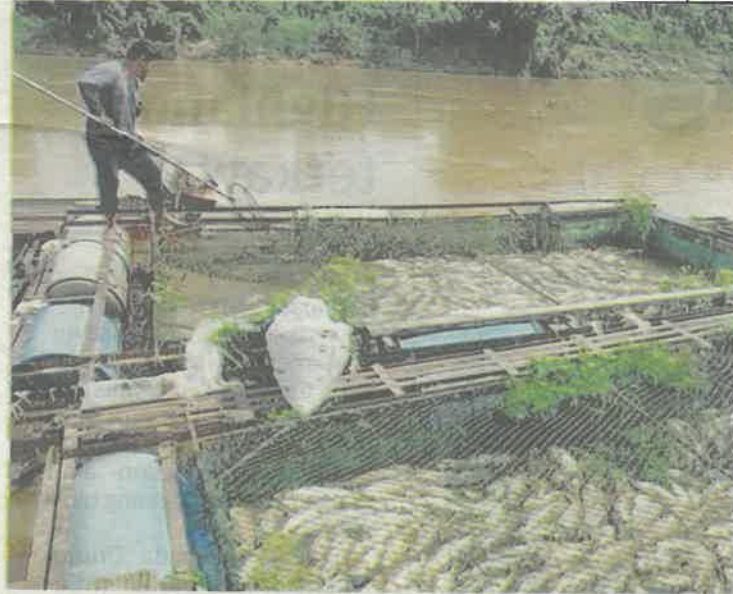
SEORANG penternak melihat bangkai ikan patin dan tilapia yang mati di Kampung Jerantut Feri, Jerantut, Pahang.