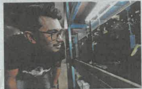
IKAN gapi memiliki potensi besar untuk dikembangkan di negara ini.

"Inilah yang saya cuba buat sekarang untuk buktikan bahawa ikan gapi boleh menjadi sumber pendapatan sekali gus mewujudkan peluang pekerjaan baharu di negara ini," katanya.