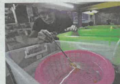
WAD 'bersalin' untuk ikan gapi.