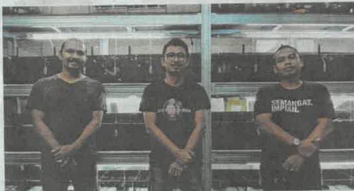
BERSAMA dua rakan yang mempunyai minat sama.

Alhamdulillah biarpun perniagaan ini dijalankan secara separuh masa, saya bersyukur, ia dapat menjana pendapatan sampingan