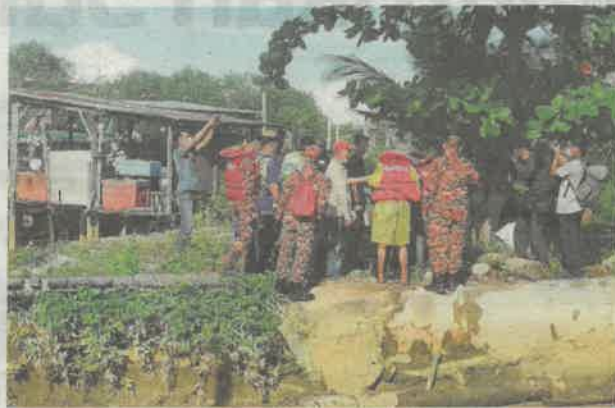
Anggota bomba membantu dua nelayan yang diselamatkan selepas bot dinaiki mereka hanyut di perairan berhampiran Jeti Parit Karang, Muar semalam.

"Seterusnya bot tersebut telah ditunda oleh sebuah bot nelayan ke Jeti Sungai Rambai, Melaka.